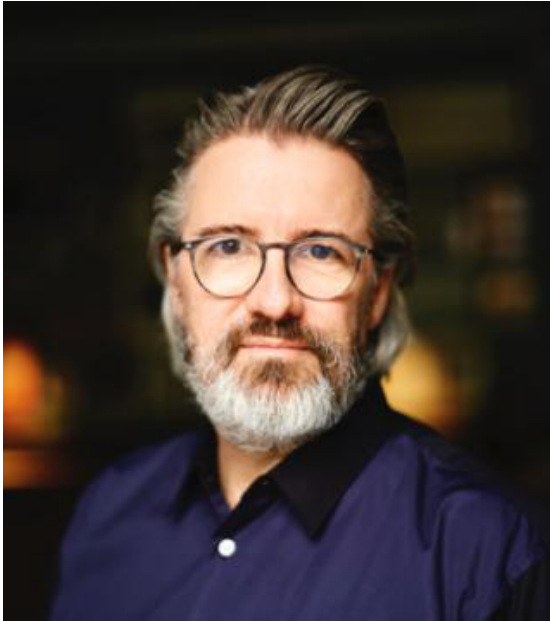
Olafur Eliasson.

Olafur Eliasson (Copenaghen, 1967) è cresciuto in Islanda e Danimarca. Dal 1989 al 1995 studia alla Royal Danish Academy of Fine Arts. Nel 1995 si trasferisce a Berlino, dove fonda lo Studio Olafur Eliasson che oggi annovera fra i suoi collaboratori un nutrito gruppo di artigiani, architetti, archivisti, ricercatori, amministratori, cuochi, programmatori, storici dell'arte e tecnici specializzati.